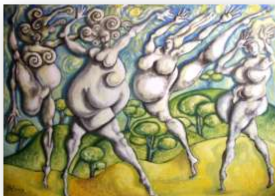
La joie 81 x 116 cm Huile / toile

Des images figuratives ombrées avec de fausses perspectives, composent le thème et donnent Les motifs peints à la manière de collages reproduits jusqu'aux limites angulaires de son support, pas un centimètre carré ne reste vierge.