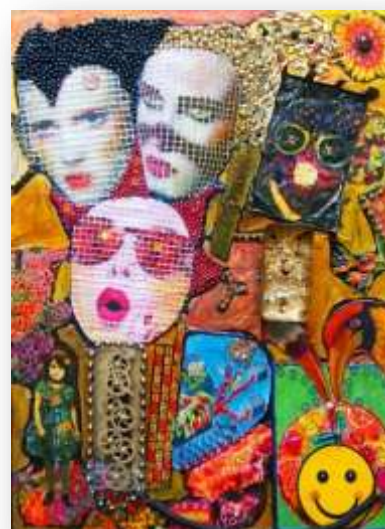
Mothers, 60x80 cm Technique mixte sur bois.

Ses origines, son parcours de vie, 30 ans d'expérimentation de multiples techniques, matériaux et bricolages, sa formation artistique ancrée dans l'art du début du XXe, produisent des œuvres syncrétiques où les influences africaines, asiatiques, industrielles et oniriques s'absorbent et se répondent. Exposée et collectionnée dans plusieurs continents, Cassie Theogene vous offre sa vision humaniste et positive du monde.