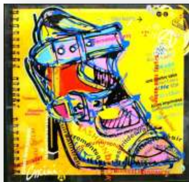
Chaussure jaune 80 x 80 cm Technique divers- Plexi