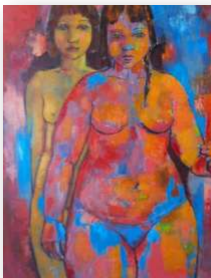
Baigneuses, 60 x 90 cm Huile sur toile 2013

Peintre et sculpteur autodidacte, Serrano est à la recherche d'un geste primitif et essentiel. Le propos de son travail : il s'agit toujours de traiter l'humain. Serrano peint et sculpte des êtres solitaires face à leur condition et nous met dans la confiance.