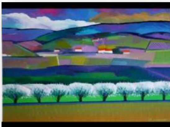
Printemps dans le Luberon 50 x 35cm Gouache papier Canson