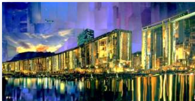
Toulon, 60 x 90 cm Collages sur toile enchâssée 2013

Diplômée des Beaux-Arts et après une première approche classique de la peinture (corps humains, grands formats à l'huile), Kaza a opéré un changement radical dans sa production, ancrée à présent dans l'actualité et les mutations de la société. Fascinée par l'urbanisme, l'artiste cherche les moyens plastiques pour rendre compte des phénomènes générés par les mégapoles, la densité des structures architecturales et les effets lumineux.